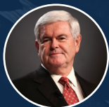
Newt Gingrich Miembro De La Junta De Directores