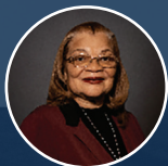
Dr. Alveda King Presidenta, Centro Del Sueño Americano