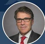
Rick Perry Presidente, Centro De Energía Y El Ambiente

Para consultas o preguntas con respecto a la Agenda de América Primero, por favor contáctenos: