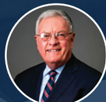
Gen. Keith Kellogg Copresidente, Centro De Seguridad Americana