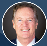
Robert Lighthizer Presidente, Centro Del Comercio Americano