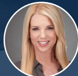
Pam Bondi Presidenta, Consortio De Litigio Constitucional Y Copresidente, Centro De Ley Y Justicia