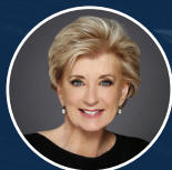
Linda McMahon Presidenta De La Junta De Directores Y Presidenta, Centro Del Trabajador Americano