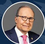
Larry Kudlow Vicepresidente De La Junta De Directores Y Presidente, Centro De Prosperidad Americana