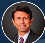
Bobby Jindal Presidente, Centro Para Una América Saludable