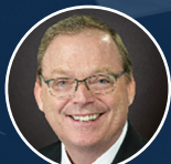
Kevin Hassett Presidente, Junta De Asesores Académicos