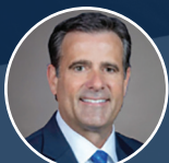
John Ratcliffe Copresidente, Centro De Seguridad Americana