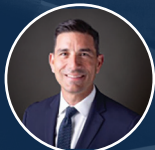
Chad Wolf Director Ejecutivo, Oficial Principal De Estrategia Y Presidente, Centro De Seguridad Nacional E Inmigración