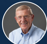
Lou Holtz Presidente, Centro Del 1776